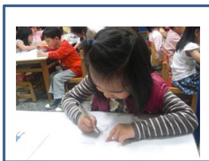
圖 2 請班上的同儕構圖

圖片線索對閱讀理解能力較弱的小飛則相當的適合，因此研究者與班級導師在一起撰寫故事之餘則請班上的同儕也一同參與繪畫的工作。