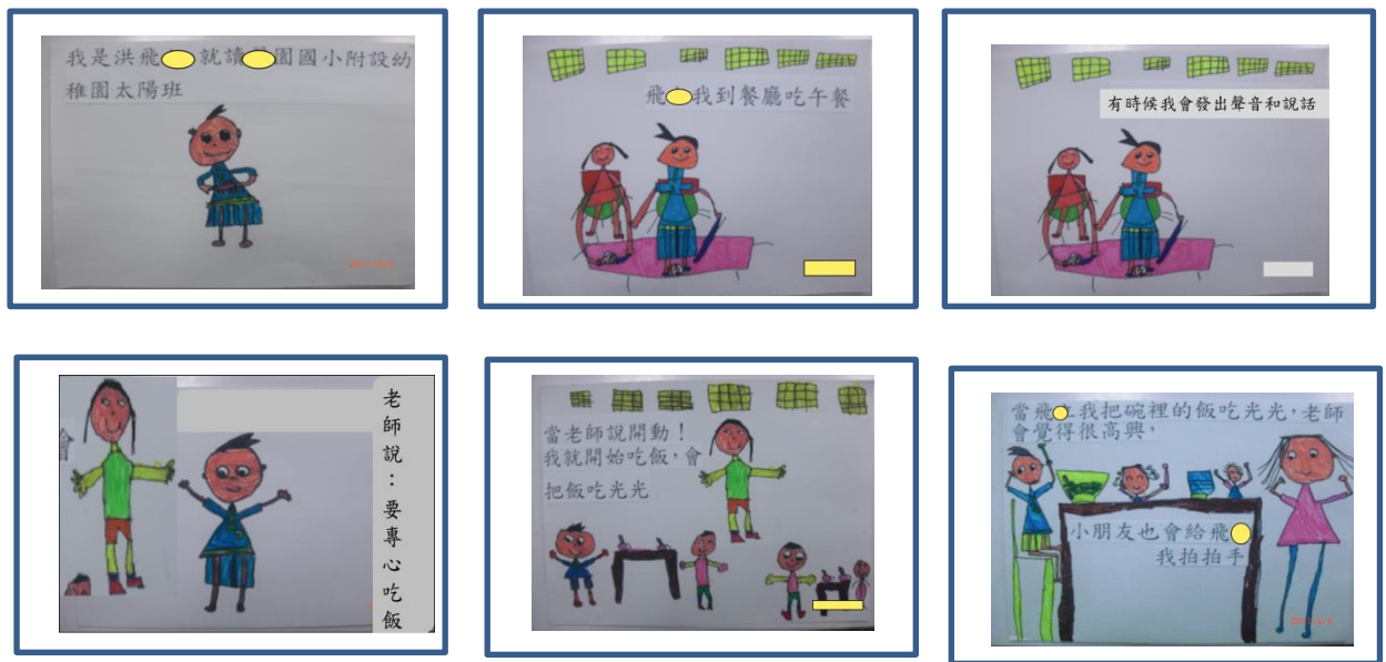
圖 3 社會故事：我會專心吃飯